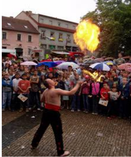
Na obrázku můžeme vidět, jak se slaví Rosa v 21. století.